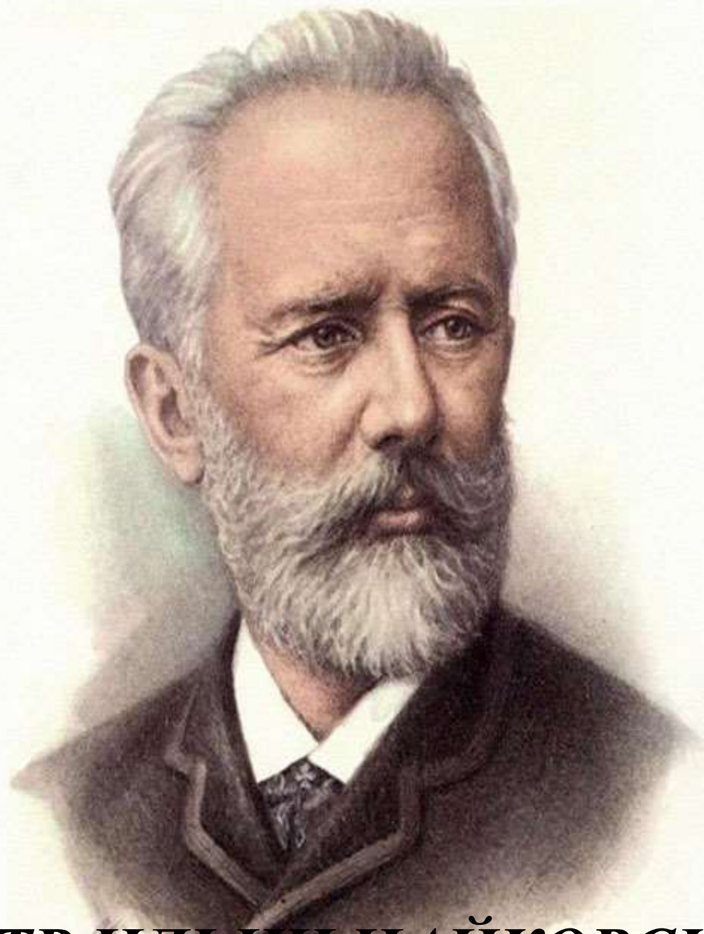
ПЁТР ИЛЬИЧ ЧАЙКОВСКИЙ