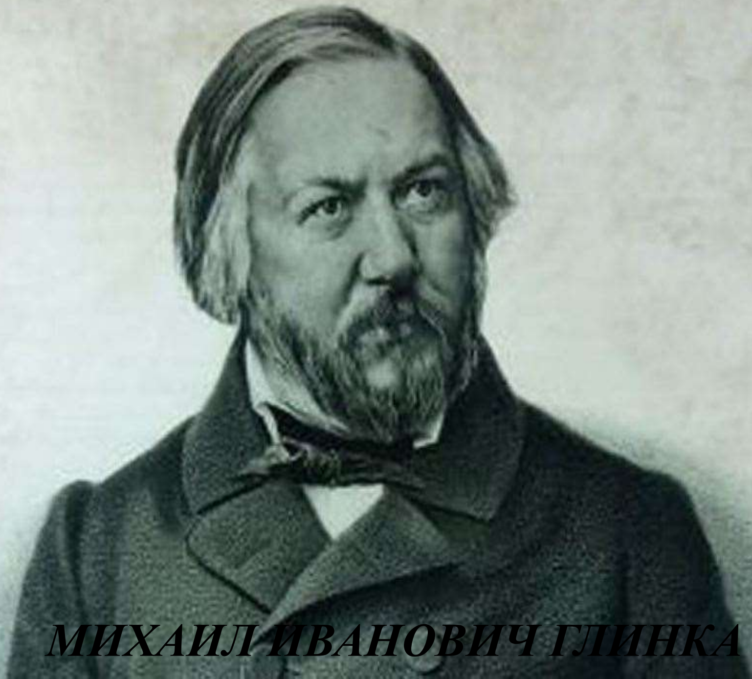
МИХАИЛ ИВАНОВИЧ ГЛИНКА